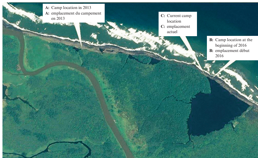
IMAGE SATELLITE EN DATE DU 3 OCTOBRE 2016 (MONTRANT LES EMBLEMES SUCCESSIFS DU CAMP NICHAGUAYEN)

SATELLITE IMAGE, 3 OCTOBER 2016 (INDICATING LOCATIONS OF NICARAGUAN CAMP)