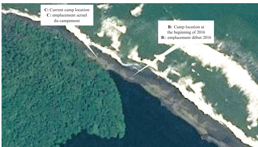
IMAGE SATELLITE EN DATE DU 3 OCTOBRE 2016 (VUE RAPPROCHÉE MONTRANT LE DÉPLACEMENT DU CAMPEMENT NICARAGUAYEN)

SATELLITE IMAGE (CLOSE-UP), 3 OCTOBER 2016 (SHOWING RELOCATION OF NICARAGUAN CAMP IN 2016)