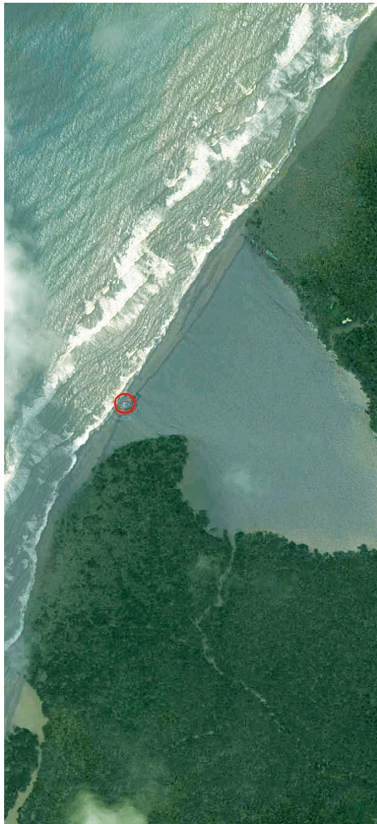
Image satellite en date du 5 juillet 2016