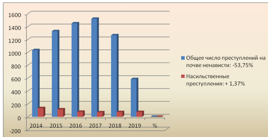
Диаграмма №2. Динамика преступлений на почве ненависти в России, 2014-2019 гг. 401

307. И в 2018, и в 2019 гг. это практически не отразилось на статистике насильственных преступлений - их число продолжало снижаться в соответствии с установившейся с 2015 года традицией. Так, если в 2018 г. общее число преступлений экстремистского характера составляло 1'265 кейсов, из них насильственных было зарегистрировано 73 (включая терроризм), то в 2019 г. это соотношение составило 585 к 74. 402