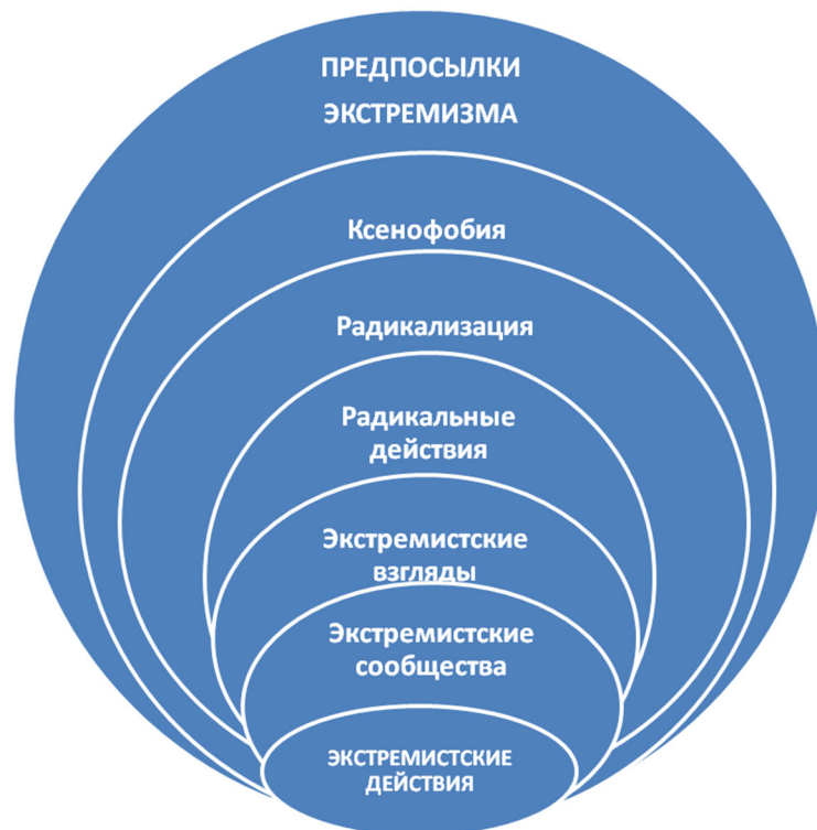
Диаграмма 1. Модель формирования экстремистских сообществ.