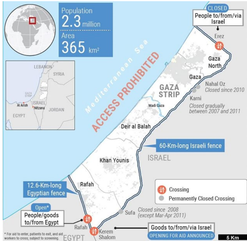
Map of the Gaza Strip 81

coast 82 , — identified by Israel on the resumption of hostilities in the first week of December 2023 as a purportedly “safe zone” 83 . Around 160,000 more displaced Palestinians are believed to remain in UNRWA facilities in the North 84 , as well as others sheltering in other locations.